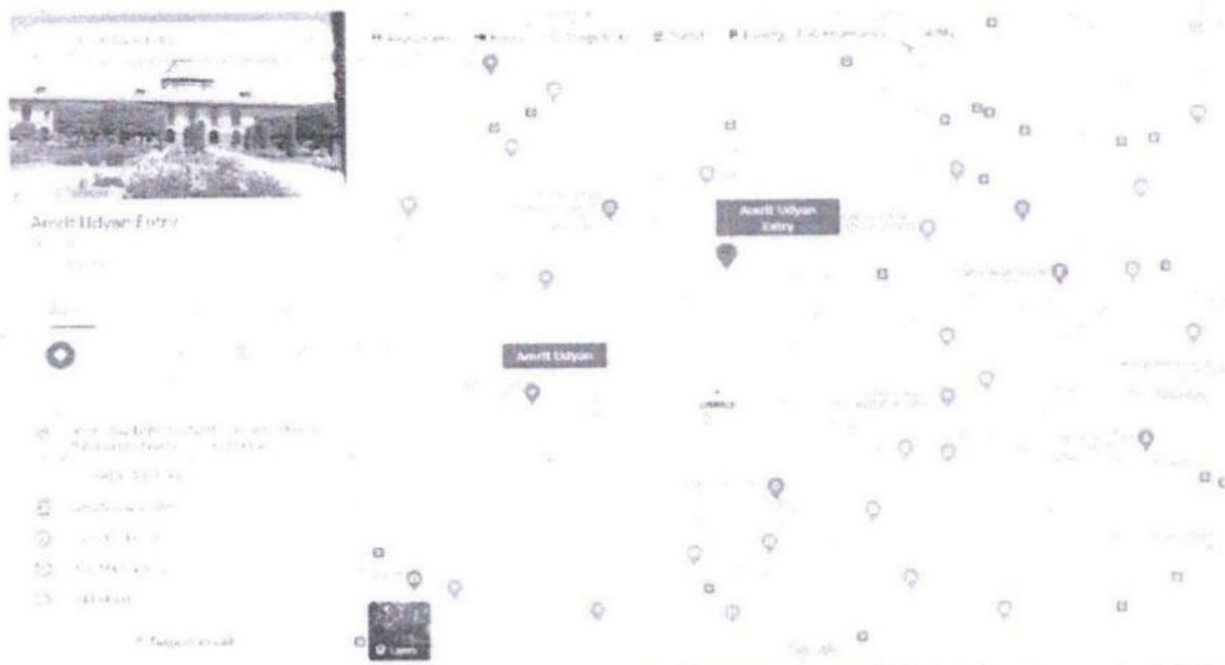
(Map with entry location at Gate 35 highlighted)